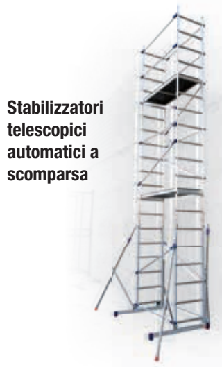
Stabilizzatori telescopici automatici a scomparsa

BASE: 114x156 cm STRUTTURA: 58x156 cm PIANO LAVORO: 51x143 cm