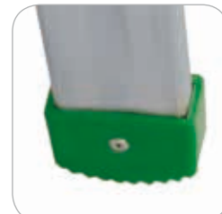
5 cm - hohe Gummischeuhe