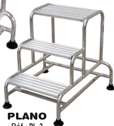
PLANO Réf.: PL-3