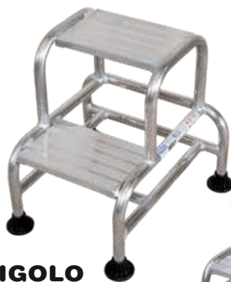
RIGOLO Réf.: RG-2