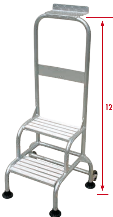
RIGOLO PLUS Réf.: RG-2PL