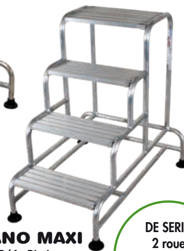
PLANO MAXI Réf.: PL-4