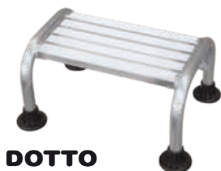
DOTTO Réf.: DT-1