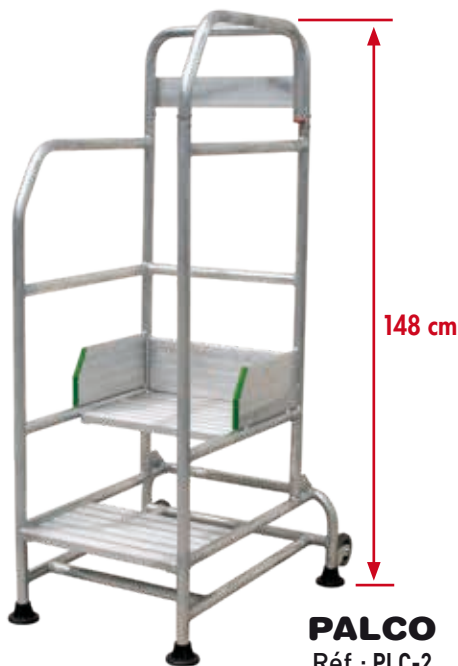
PALCO Réf.: PLC-2

DE SERIE : 2 roues basculantes: Réf. : RG-2PL / PLC-2