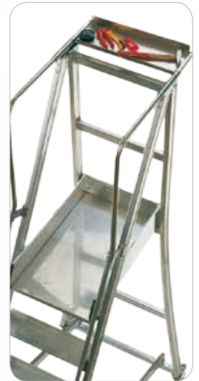
Plataforma (48x77 cm) y bandeja porta objetos en lámina de aluminio anti deslizante