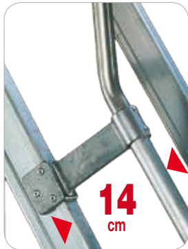
Soportes en aluminio fundido