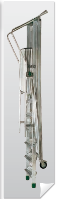
Transporte y almacenamiento