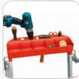
Große Ablageschale für Werkzeuge und Kleinteile (Bis 10 kg belastbar).