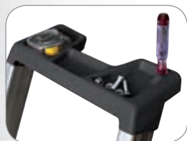
Porta utensili e presa della mano

La doppia inclinazione permette ottima aderenza alla parete