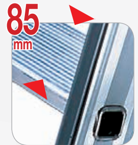
Gradini profondi 85 mm