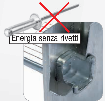
Energia senza rivetti