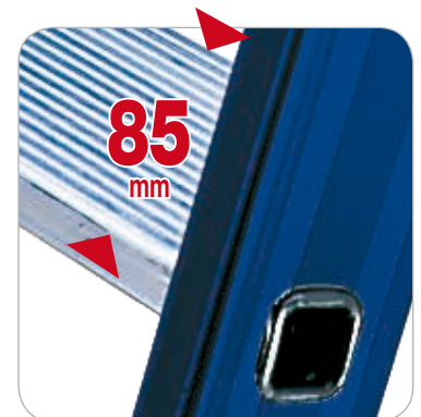
Stufentiefe 85 mm aus Aluminium natur.