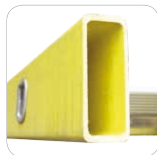
Montant fibre de verre. Echelon en aluminium