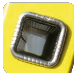
Echelon carré 30 x 30 mm

MISE A JOUR AVEC LA NOUVELLE NORME: 01/2018