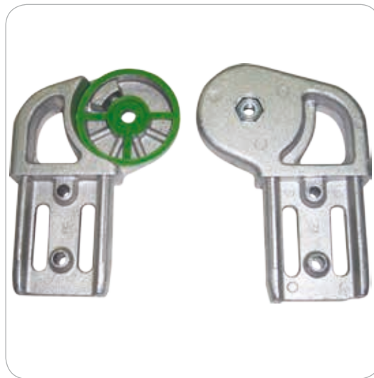
Articulation en fonte d'aluminium avec insert en polyamide pour réduire le grippage des matériaux