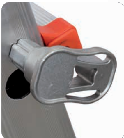
Tirante di blocco gradino in alluminio fuso e inox DESIGN FACAL