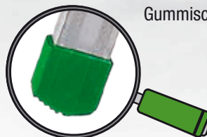
Große rutschfeste Gummischeuhe.