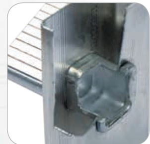
Dreifach geweitete und gebördelte Stufen-Holm-Verbindung.