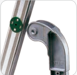
Scharniere aus Gussaluminium mit Nylonüberzug um Abrieb an den Metallteilen zu verhindern.