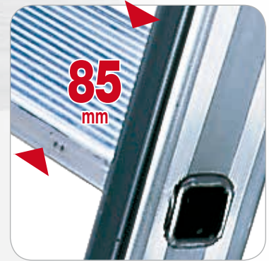
Stufentiefe 85 mm.