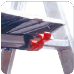
SECURITE : Anti-soulèvement assuré grâce à la biellette de sécurité autobloquante