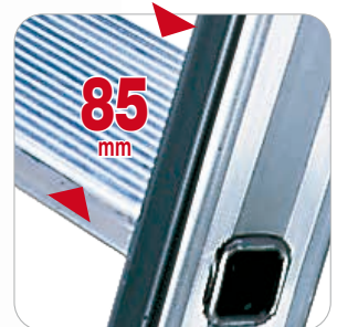
Marches en aluminium de 85 mm de profondeur, striées antidérapantes

MISE A JOUR AVEC LA NOUVELLE NORME: 01/2018