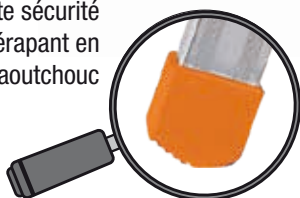
Patin haute sécurité antidérapant en caoutchouc