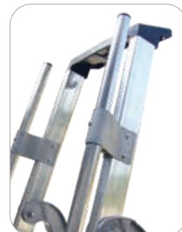
EN OPTION : 2 rampes de sécurité en aluminium montées par nos soins

TRES IMPORTANT 2 inclinaisons différentes. Le plan de montée incliné à 68° permet une utilisation plus douce. La béquille inclinée à 75° permet au marchepied, de se positionner près du mur et donne une plus grande rigidité au produit