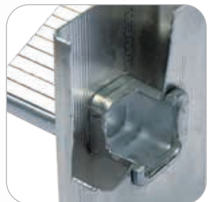
Liaison montant / marche par triple expansion et sertissage carré anti-rotation