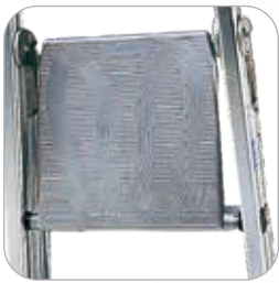
Plate-forme en fonte d'aluminium