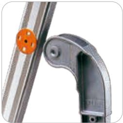
Articulation en fonte d'aluminium avec insert en polyamide pour éviter l'usure