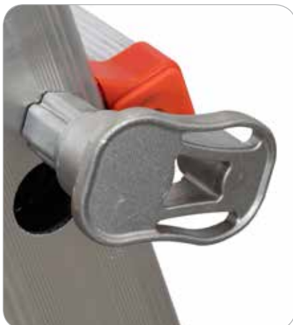
Tirante de bloqueo peldaño en aluminio fundido e inoxidable