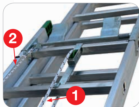
Speciale meccanismo a bilanciere d'acciaio 1 Fune di tiro/trascinamento 2 Fune secondaria di richiamo del bilanciere