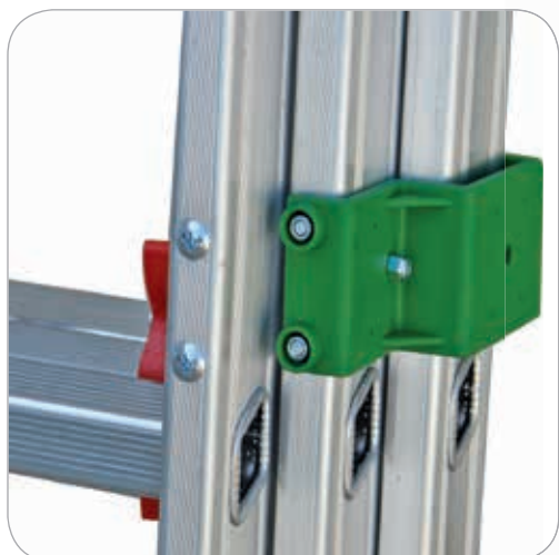
Bracciali di scorrimento d'acciaio ricoperti in mescola di nylon