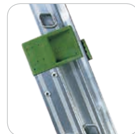
Schiebeelemente mit Nylon überzogen.