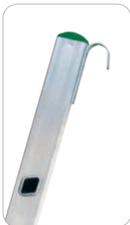
ZUBEHÖR: Einhängehaken aus Stahl.