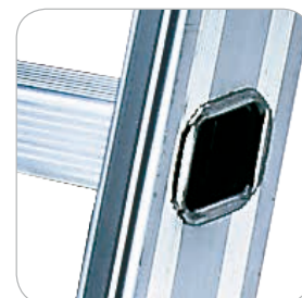
Sprossen 30x30 mm, rhombisch eingebaut für optimalen Stand und Arbeitskomfort.