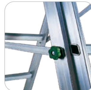
Forti barre anti chiusura ed anti divaricamento in alluminio bloccabili ad espansione