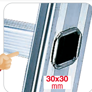
30x30 mm Rombo inclinato