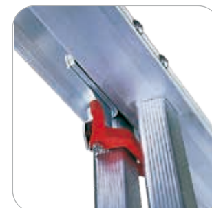
Arresti anti sfilo montati sui ramponi di aggancio (EN131)