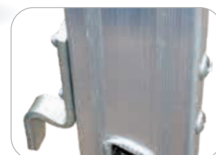
Ramponi in acciaio fissati ai montanti con viti passanti