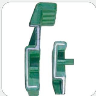
SICUREZZA: Anima in acciaio ricoperto