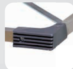
Piede posteriore anti scivolo