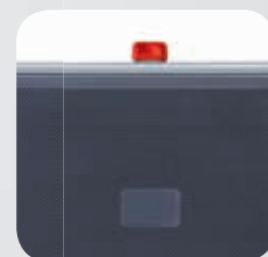
Blocco di sicurezza dei gradini