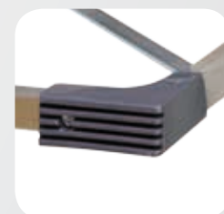
Füßen - Stützteil