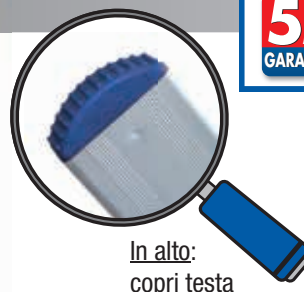
In alto: copri testa

Di dimensioni contenute è particolarmente leggera maneggevole e molto rigida per le leghe usate. Ideale per uso intensivo industriale ed agricolo.