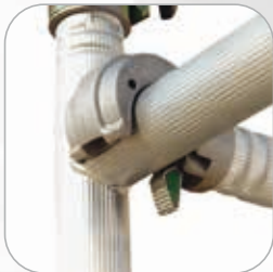
Verrouillage automatique très rapide des lisses et diagonales