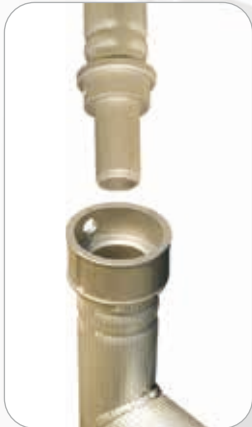
Jonction en fonte d'aluminium avec goupille