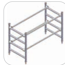
Ensemble terminal 4 échelons (Réf. C5-1326)