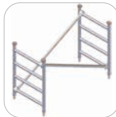
Ensemble rehausse 4 échelons (Réf. C3-1326)