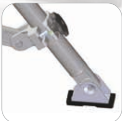
Stabilisateurs avec patins articulés antidérapants. Acier + Caoutchouc