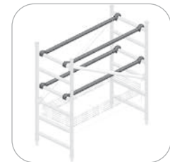
Protections horizontales pour plateau (Réf. C134-1326)