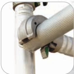
Verrouillage automatique très rapide des lisses et diagonales