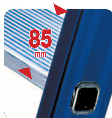
Stufentiefe 85 mm aus Aluminium natur.