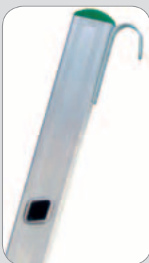
Einhängehaken aus Stahl

Groß schwenkbarer Gelenkfuß; Struktur aus Stahl mit rutschsicherem Gummibelag. Leiterholmabmessung 25x80 mm.