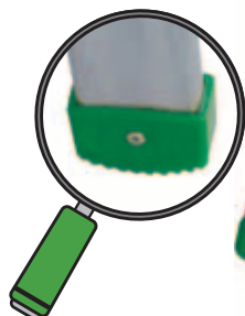
5 cm - hohe Gummischuhe

Hoher Arbeitskomfort Dank der 68° - Neigungswinkels der Sprossen mit Facal Patent!