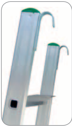
ZUBEHÖR Einhängenhaken aus Stahl.

Wichtige Merkmale!! Dreifach geweitete und gebördelte Sprossen-Holm- Verbindung.