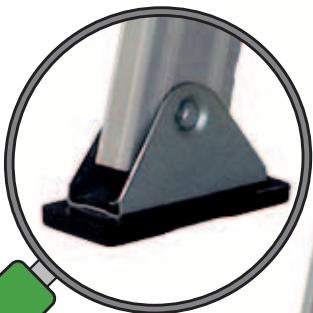
Serienmäßig schwenkbare rutschfeste Gelenkfüße.