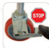
Rollen Ø 200 mm mit getrennten Hebeln für Brems- und Lösefunktion.