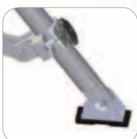
Ausleger mit schwenkbaren rutschfesten Gelenkfüßen. Stahl und Gummi.