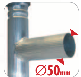
Geschweißte Sprossen. Ø50mm