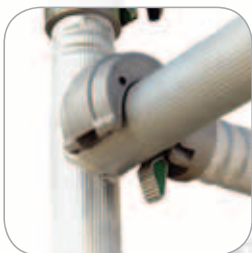
Schnelles und automatisches Befestigungssystem für die Horizontal- und Diagonalstreben.