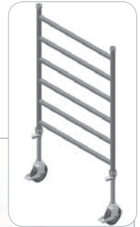
Rahmenteile mit Lenkrollen