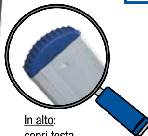
In alto: copri testa