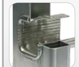
Pioli fissati energicamente ai montanti con doppia allargatura idraulica e ribordatura. SENZA RIVETTI!!