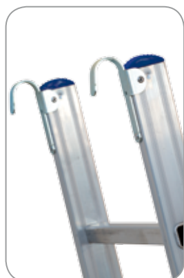
ACCESSORIO: coppia di ganci leggeri con alette Art.: FE-119/A

STILO/S è scala semplice d'appoggio a pioli quadri 24x24 mm in leghe d'alluminio speciali. Calzari alti in gomma antisdrucciolo di base e copri testa in alto. Di dimensioni contenute è particolarmente leggera maneggevole e molto rigida per le leghe usate. Ideale per uso intensivo industriale ed agricolo.