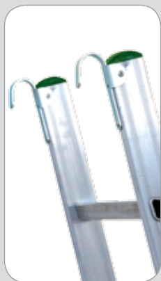
coppia di ganci leggeri con alette Art.: FE-119/A

piede snodato grande con zoccolo d'acciaio ricoperto in gomma per montante 25x80 mm