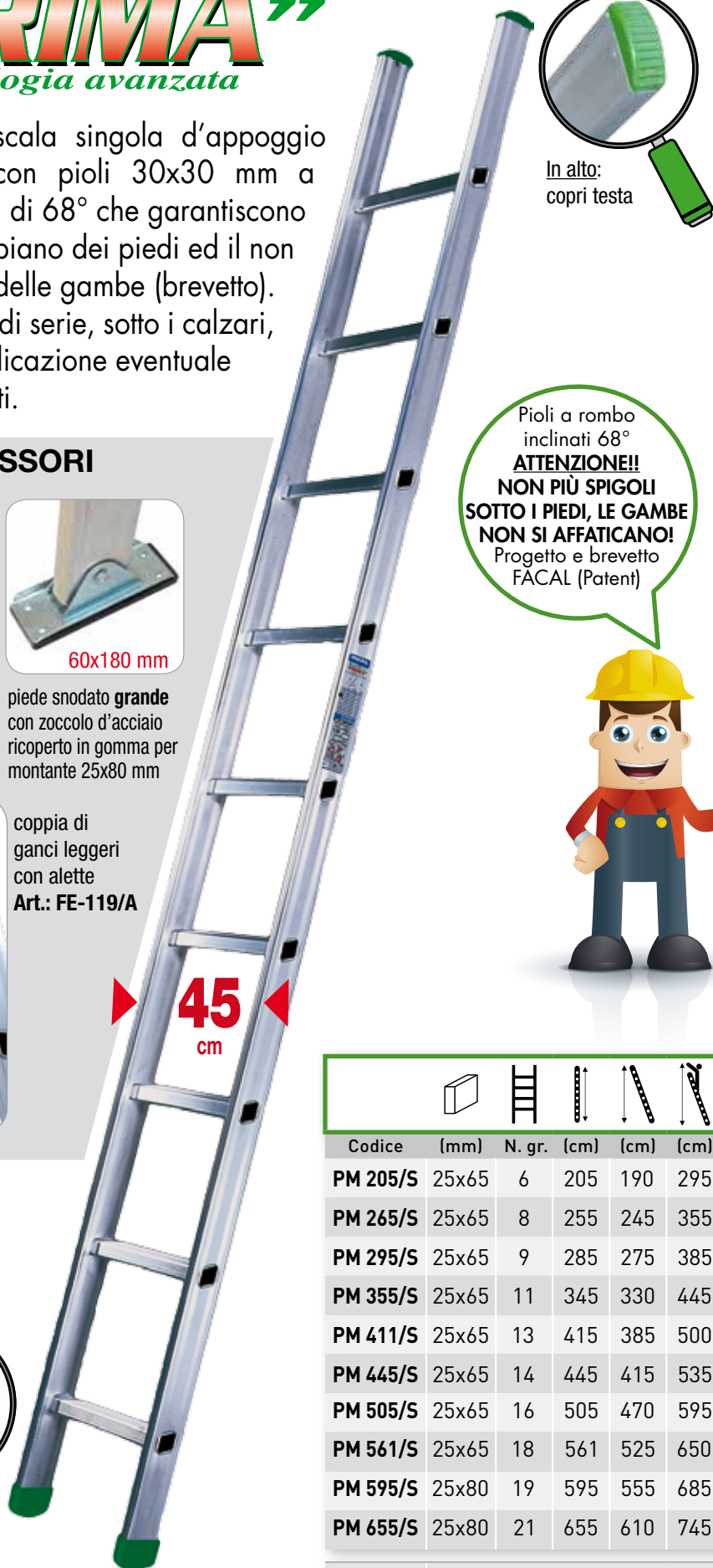
In alto: copri testa

Pioli a rombo inclinati 68° ATTENZIONE!! NON PIÙ SPIGOLI SOTTO I PIEDI, LE GAMBE NON SI AFFATICANO! Progetto e brevetto FACAL (Patent)