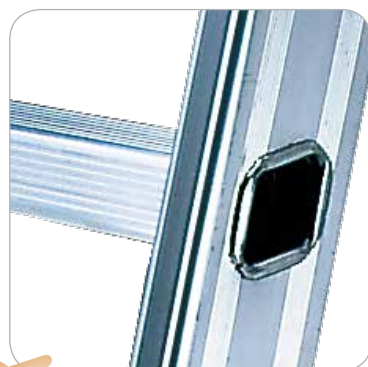
Piolo a ROMBO 30x30 mm inclinato