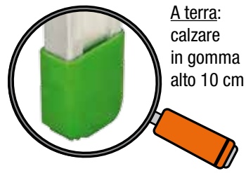
A terra: calzare in gomma alto 10 cm