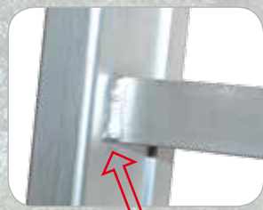
Piolo con saldatura aggiuntiva sul retro