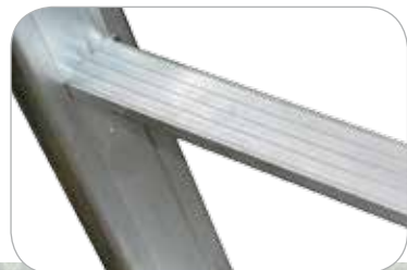
Piolo a trapezio ribordato e saldato con anima tornita