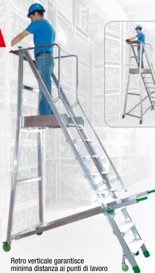
Retro verticale garantisce minima distanza ai punti di lavoro

Conforme alla normativa: EN131-7 (con stabilizzatori)