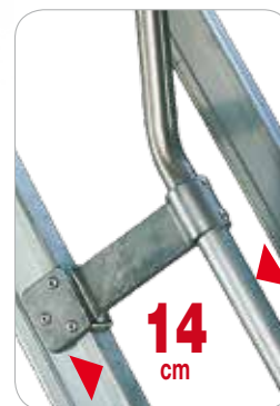
Eleganti giunzioni e supporti in alluminio fuso