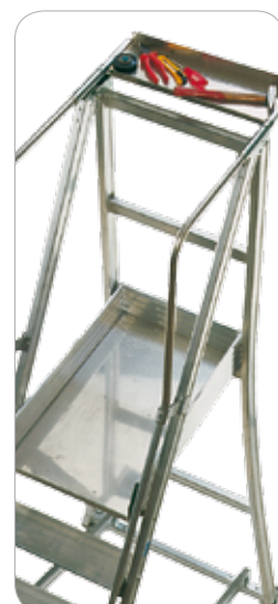
Pedana (48x77 cm) e vaschetta porta oggetti in lamiera d'arredo in alluminio anti scivolo.

CONTROLLARE ATTENTAMENTE LE MISURE PRIMA DI ORDINARE. LE CASTIGLIA NON SI SOSTITUISCONO.