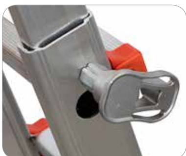
Tirante di blocco gradino in alluminio fuso e inox