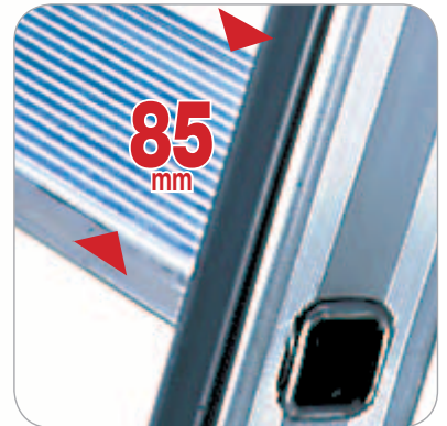
Marches en aluminium de 85 mm de profondeur, striées antidérapantes