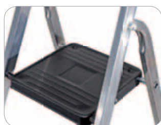
Articulation avec plate-forme