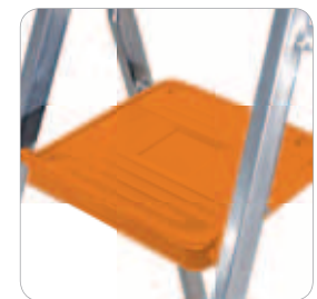
Plate-forme en acier de couleur époxy