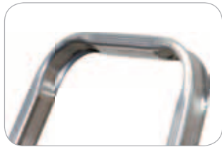
Garde-corps de sécurité