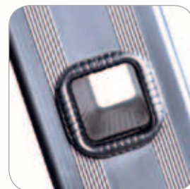
Echelon carré 30 x 30 mm