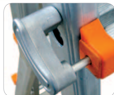
Poignée de blocage en fonte d'aluminium et acier inoxydable