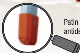
Patin haute sécurité antidérapant