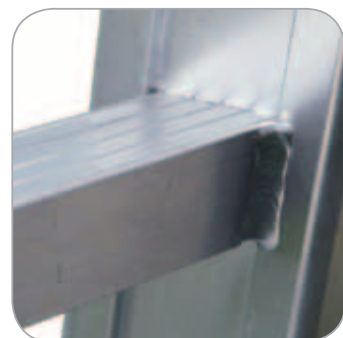
Liaison montant / échelon par sertissage et soudure supplémentaire