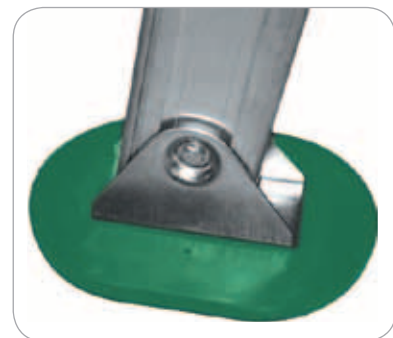
EN OPTION : Patin articulé ovale 16 x 11 cm en caoutchouc pour éviter l'enfoncement de l'échelle dans le sol