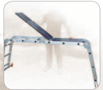
EN OPTION : plateau pliable en bois (dimension 29,5 x 161 cm)