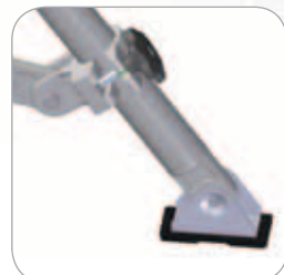
Stabilisateurs avec patins articulés antidérapants. Acier + Caoutchouc