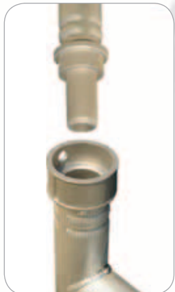
Jonction en fonte d'aluminium avec goupille