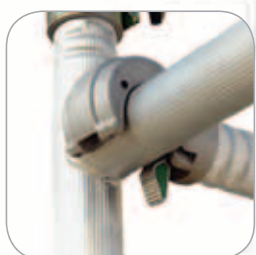
Verrouillage automatique très rapide des lisses et diagonales