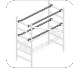
Protections horizontales pour plateau (Réf. C134-1122)