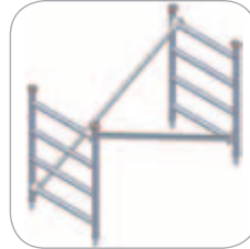
Ensemble rehausse 4 échelons (Réf. C3-1122)