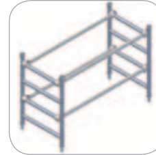
Ensemble terminal 4 échelons (Réf. C5-1122)