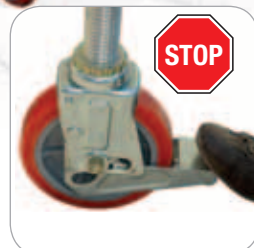
Roues Ø 200 mm avec frein