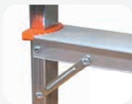
4 diagonales de renfort