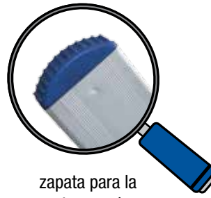
zapata para la parte superior