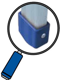
Zapata de 5 cm