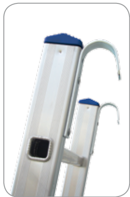
ACCESORIOS: Ganchos de acero