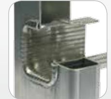
Peldaños fijados a los montantes con doble ensanchamiento hidráulico rebordecado. SIN REMACHES