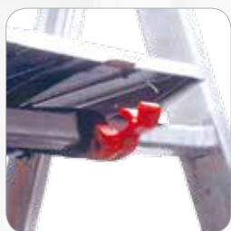
SEGURIDAD: Gancho para el bloqueo de la plataforma