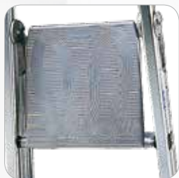
Plataforma en aluminio fundido