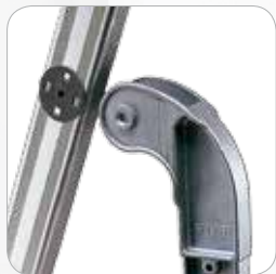
Bisagras en aluminio fundido con fricciones bilaterales interpuestas