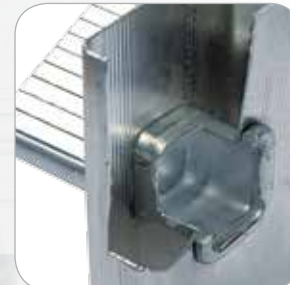
Firme doble bloqueo hidráulico sin remaches