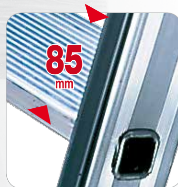
Peldaños con profundidad de 85 mm