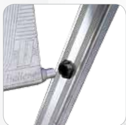
Cojinete en nylon donde gira la plataforma