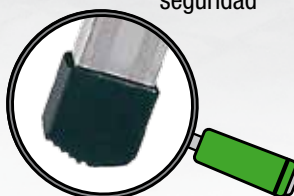
Altas zapatas de goma para la máxima seguridad