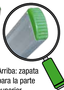
Arriba: zapata para la parte superior