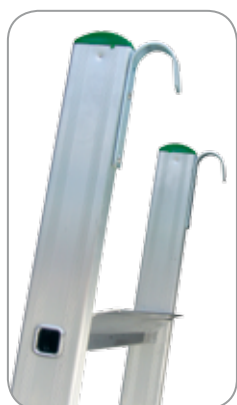
ACCESORIOS: Ganchos de acero