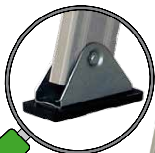
Abajo: Zapatas basculantes. Estructura de acero con final en goma de serie