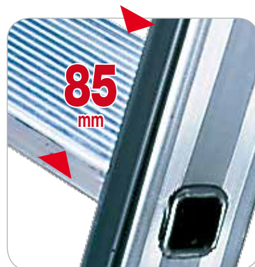
Profundidad del peldaño 85 mm

CÓMODOS PELDAÑOS CON UNA PROFUNDIDAD DE 85 MM CON BLOQUEO DOBLE MECÁNICO (¡SIN REMACHES!) PROYECTO FACAL