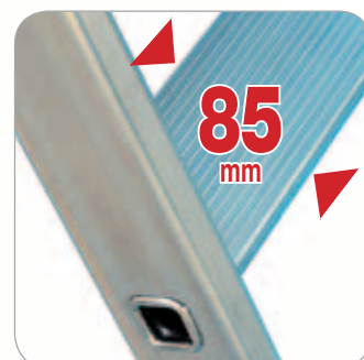
Marches en aluminium de 85 mm de profondeur, striées antidérapantes