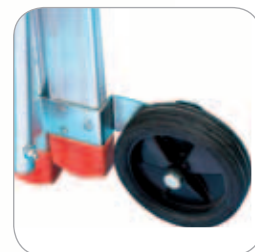
2 roues Ø 150 mm avec support en acier