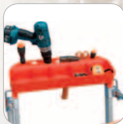
Porte-outils avec beaucoup d'espaces de rangement (résistance jusqu'à 10 kg)