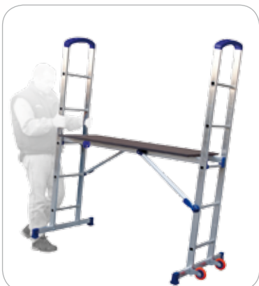
Fácil de mover gracias a las ruedas de goma de 100 mm