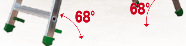
INCLINACIÓN DE TRABAJO 68° EN AMBOS LADOS