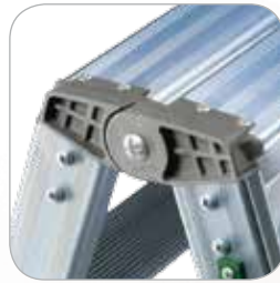
Bisagras en aluminio fundido