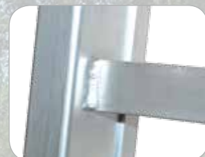
Peldaño con soldadura adicional en la parte posterior