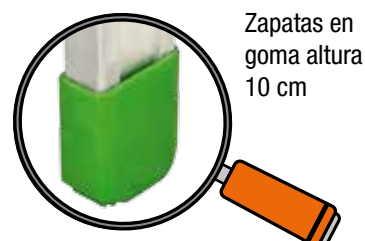
Zapatasy en goma altura 10 cm