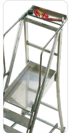
Plataforma (48x77 cm) y bandeja porta objetos en lámina de aluminio anti deslizante