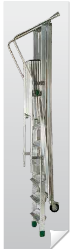
Transporte y almacenamiento