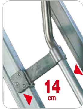
Soportes en aluminio fundido