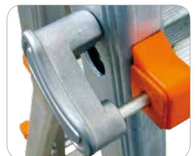
Tirante de bloqueo peldaño en aluminio fundido e inoxidable