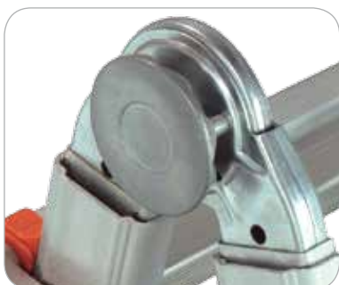
Bisagra automática de acero