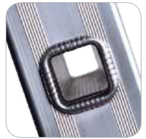
Peldaño seccionado cuadrado 30x30 mm