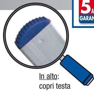
In alto: copri testa

Di dimensioni contenute è particolarmente leggera maneggevole e molto rigida per le leghe usate. Ideale per uso intensivo industriale ed agricolo.