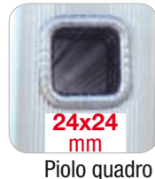
24x24 mm Piolo quadro