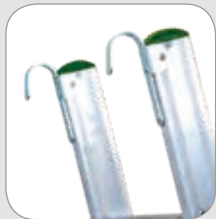
ZUBEHÖR Einhängehaken aus Stahl.