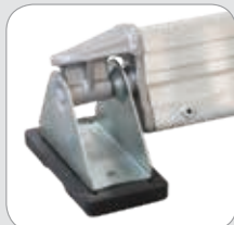
Verbinder aus Gussaluminium mit schwenkbarem Gelenkfuß für die Traverse