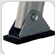
Schwenkbare rutschfeste Gelenkfüße