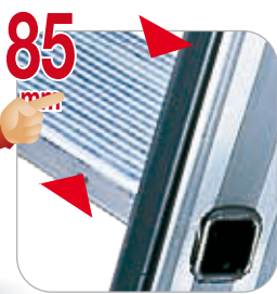
Gradini profondi 85 mm