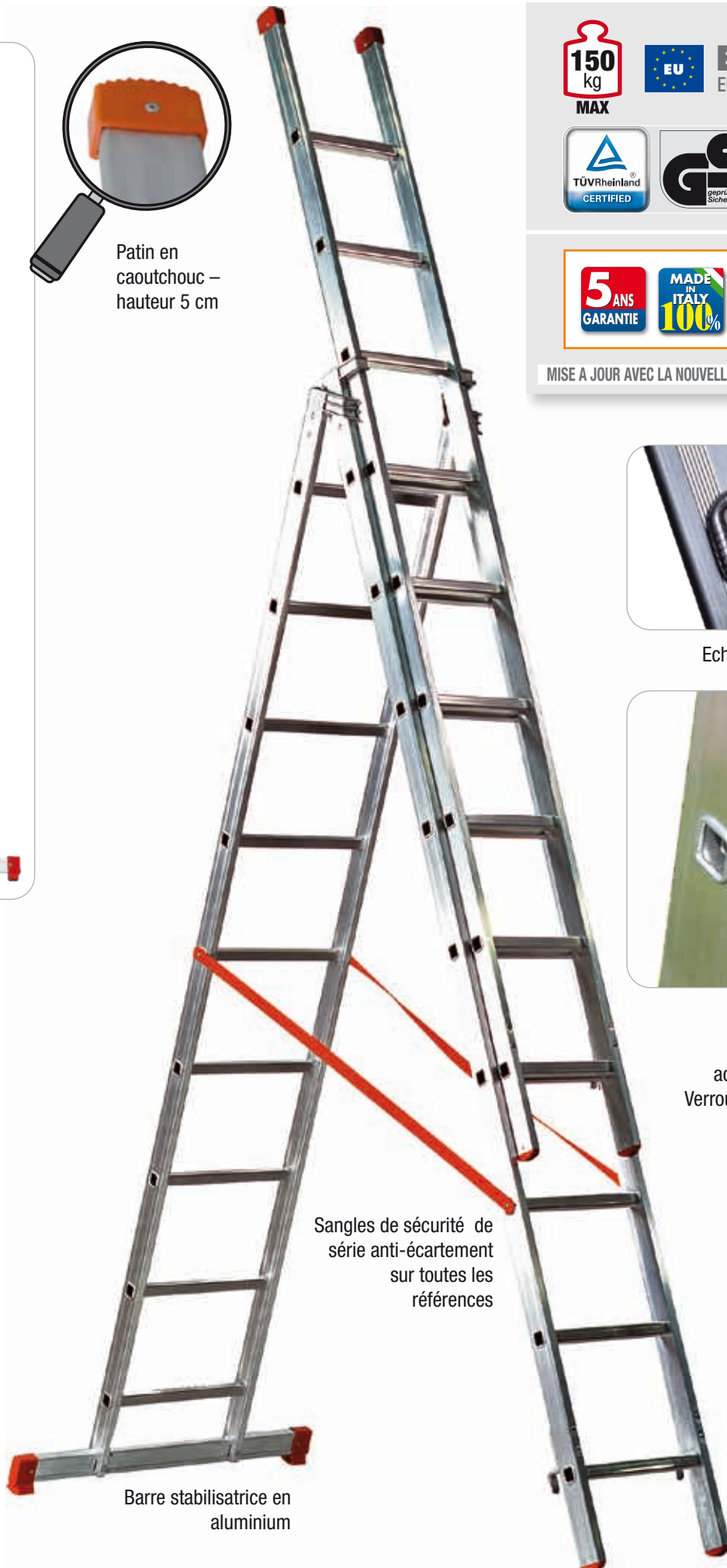
Sangles de sécurité de série anti-écartement sur toutes les références