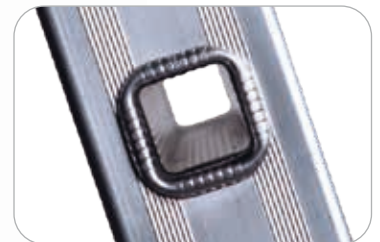
Echelon carré 30 x 30 mm

MISE A JOUR AVEC LA NOUVELLE NORME: 01/2018