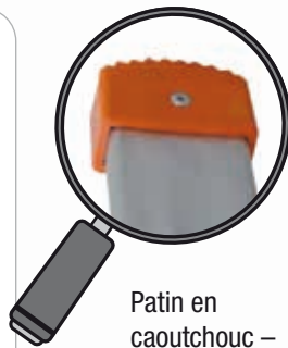
Patin en caoutchouc – hauteur 5 cm